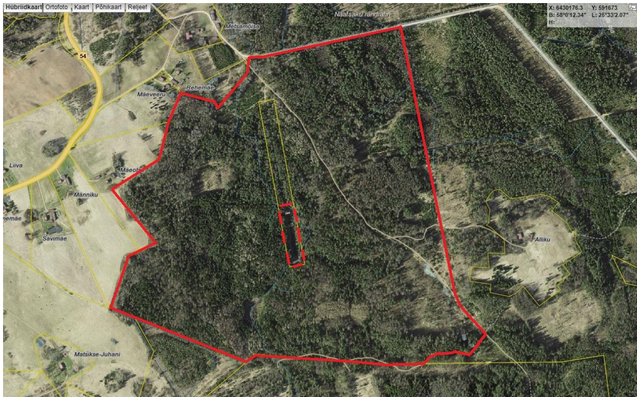
Kaart 2. Kodanikuliikumise Eesti Metsa Abiks ettepanek ortofotol.